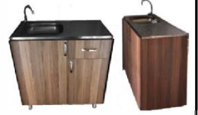
45x85 Krom Evely suntalem All Dolap